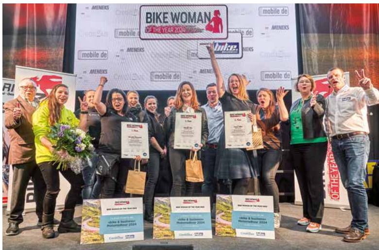
Die Top 3 zusammen mit den Sponsoren Creditplus, Meneks und mobile.de sowie den Jurymitgliedern der Communitypartner She Rides und Petrolettes.